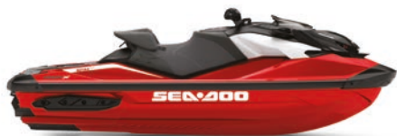
● NOVITÀ Rosso Fiere Premium