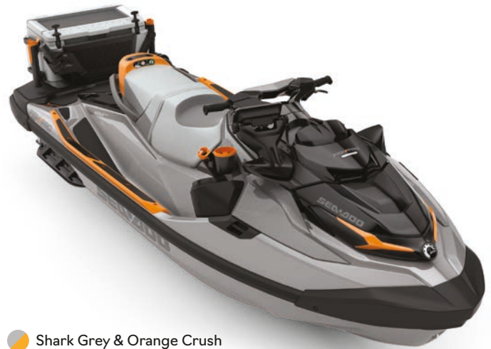
Shark Grey & Orange Crush