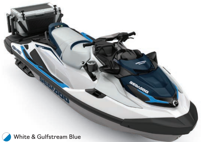
White & Gulfstream Blue