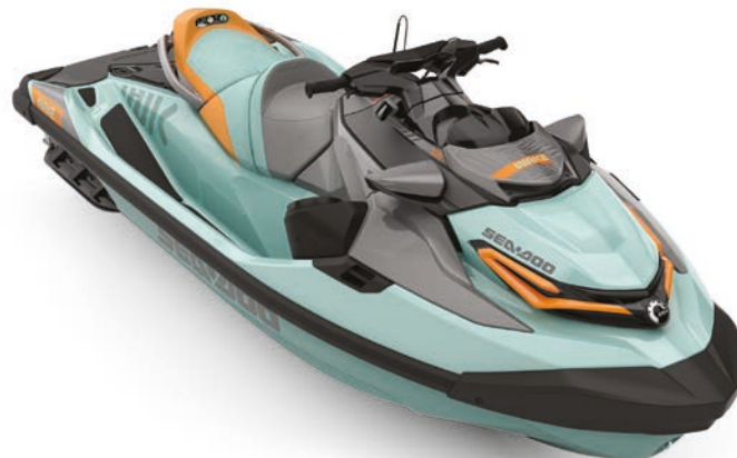
● Neo Mint