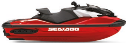
● UUSI Fiery Red Premium