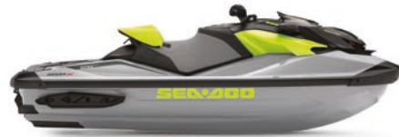
● UUSI Ice Metal ja Manta Green