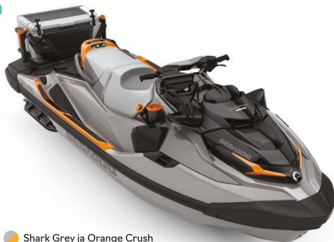
Shark Grey ja Orange Crush