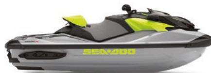
● NIEUW Ice Metal en Manta Green