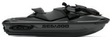
● Triple noir Couleur haut de gamme