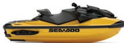
● Jaune millenium