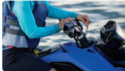
Guidon avec bloc d'élévation réglable Un système de direction télescopique qui optimise l'expérience pour tous les conducteurs, peu importe leur grandeur..