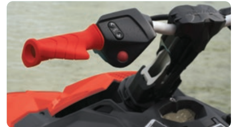
Correcteur d'assiette (VTS MC ) à capacité étendue Permet le double du rayon du VTS normal pour des figures plus faciles et plus exagérées sur la SPARK.