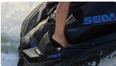
Appuie-pieds arrière Procure une stabilité et une confiance accrues dans différentes positions de conduite, ce qui facilite l'exécution de figures, comme un pro.