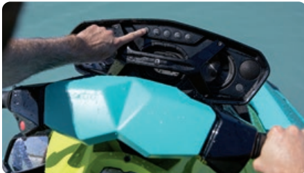
Système audio-portatif BRP (en option) Un système audio portable Bluetooth 1 de 50 watts, étanche et haut de gamme.