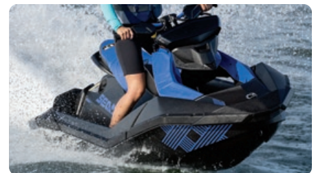
Couleur et graphiques exclusifs Couleur et graphiques exclusifs Trixx.