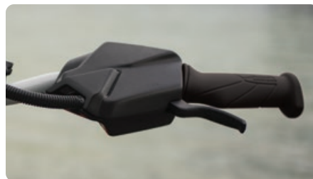
iBR® (Système de frein et marche arrière intelligents) Exclusif à Sea-Doo, iBR vous permet d'immobiliser votre motomarine plus tôt tout en vous procurant plus de maniabilité à basse vitesse et en marche arrière.