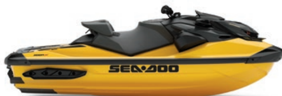
● Jaune millenium